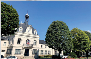
Mairie de Bry sur Marne

Située aux portes de Paris, bordée par la Marne, la commune bénéficie d'une situation idéale favorisée par la proximité de nombreux axes routiers et d'une gare de la ligne RER A.