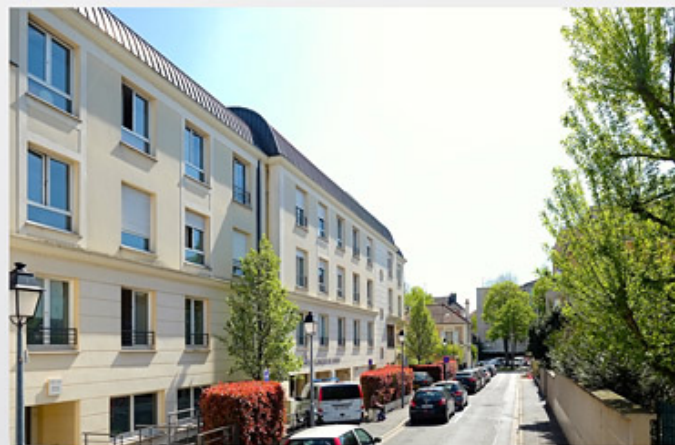
Rue Ledru Rollin