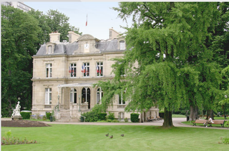
Mairie de Choisy le Roi

Située à 7 kilomètres des portes de Paris, Choisy le Roi bénéficie d'une situation idéale favorisée par la proximité de nombreux axes routiers et d'un dense réseau de transports en commun. L'arrivée prochaine des tramways Paris-Orly et TZen facilitera encore les déplacements vers Paris renforçant les atouts indéniables de la commune.